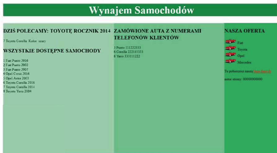
Rysunek 2. Witryna internetowa